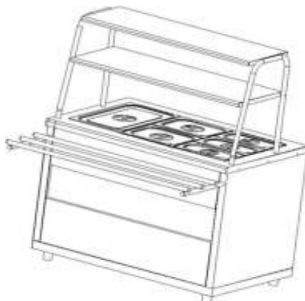
Рис.1 Общий вид мармита МЭП-2Б-П/ЛП, МЭП-2Б-П/ЛПЭ

Общий вид мармита представлен на рис. 1. В серии «Ли́ра-Профи» корпус мармита изготовлен из нержавеющей стали, в серии «Ли́ра-Профи Э́ко» отдельные элементы изготовлены из окрашенной оцинкованной стали. В столешницу мармита встроена прямоугольная паровая ванна с электронагревательными элементами.