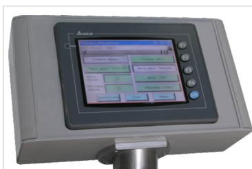
Сенсорная панель управления «Прима-300»