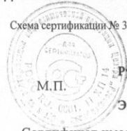
Схема сертификации № 3. Маркирование продукции знаком соответствия производится по ГОСТ Р 50460-92.